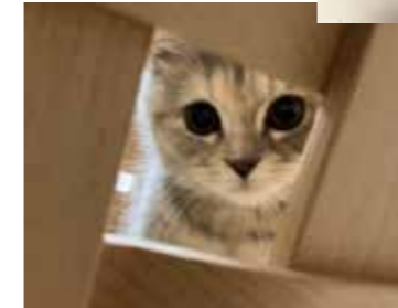
ちょっとだけ覗かせて