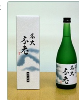
紙のカートン入り

「北部購買」にて販売をしております。購入の際は年齢確認をさせていただきます。また、各種懇親会、パーティでも提供させて頂いております。