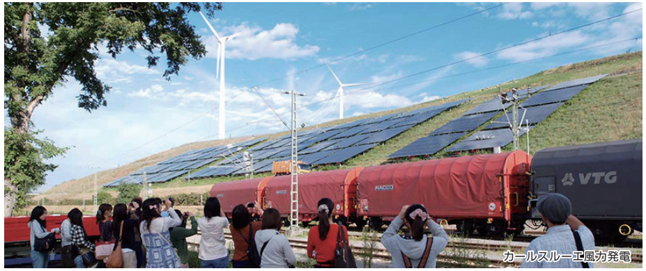
カールスルーエ近郊の風力発電

ドイツの「環境首都」として名高いフライブルクを中心に持続可能な地域社会について、エネルギー、交通政策、まちづくりといった視点から学びます。様々な視察先をドイツ在住の環境ジャーナリストの解説を受けながら共通の問題意識を持つ参加者(大学生)と巡ることで、単なる視察に終わらず日本を振り返り、視野を広げ、お互いの考えを深めることができるでしょう。