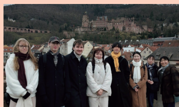
point 4 学生交流

国境を越えてストラスブールに行きましょう! 過去にはドイツとフランスが領有権を争ったアルザス地方に位置し現在は欧州議会や欧州裁判所もあるEUの象徴的な都市です。先進的な都市交通と古い町並みが見事に調和しています。国境のまちを散策することであらたな発見があることでしょう。