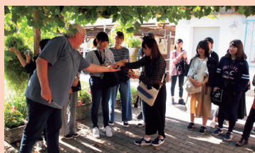
point 1 カールスルーエ

「人が主役のまちづくり」をクラインガルテン(市民農園)を訪問し、環境に負荷をかけないトラムに乗り、パークアンドライドの現場を訪ねることで体感します。また近郊の古くからの大学都市ハイデルベルクを単なる観光ではなく、環境とまちづくりの視点で見学をします。