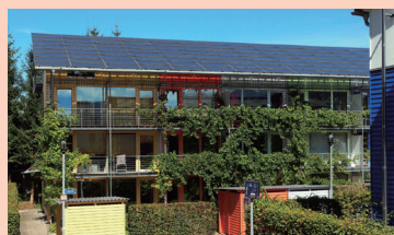
point 2 フライブルク

「人が主役のまちづくり」をクラインガルテン(市民農園)を訪問し、環境に負荷をかけないトラムに乗り、パークアンドライドの現場を訪ねることで体感します。また近郊の古くからの大学都市ハイデルベルクを単なる観光ではなく、環境とまちづくりの視点で見学をします。