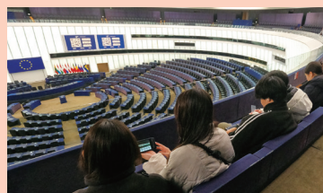
point 3 ストラスブール(フランス)

「フライブルクのまちづくり」を体験、理解するために、旧市街地、環境配慮型の住宅地、団地の再生などをトラムで移動し、歩き、都市計画について学びます。また、省エネ建築や地域熱供給、再生エネを活用したプラスエネルギー建築などを視察し、日独の制度の違いについても説明を受けながら、意見交換を行います。