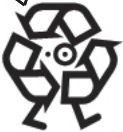
解説:リサイクル君