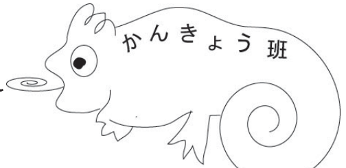
マスコットキャラ:カメレオン

かんきょう班というのは、まあ簡単に言ったら環境のことを考えて活動していこうという団体のことです。なに? 適当すぎてわからない? しょうがないなあ、それじゃあ具体的に去年何をやったか書き出していきます。 なかなかいろんなことをやってるんですよ。ではいってみましょう!!