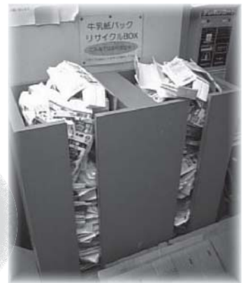
牛乳パック回収ボックスの様子だよ。すごい量の牛乳パックだね! これを全部回収してリサイクルに出すんだ。何てエコロジーなんだろう!!

これを回収して、生協を通じて「牛乳パック連合便」としてリサイクルしてくれる業者に引き渡すんだよ!