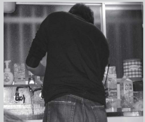
↑ ある日の料理風景

個人的には、 料理本 や インターネット で簡単なレシピを探 してレパートリーを増やすのがオススメです。写真付きの ものだとできあがりイメージしやすくて良いですよ♪