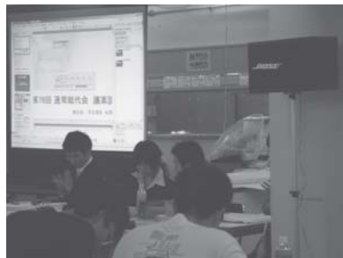
↑ 去年の総代会の様子