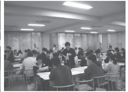
↑ 総代 meeting の様子