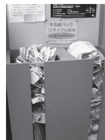
↑牛乳パック回収箱の様子