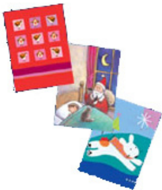
ユニセフカードの写真です。

こうやって聞くと、フェアトレードがあたかも寄付のようであると感じられるかもしれませんが、フェアトレードは、寄附ではありません。途上国の人たちに支払うお金は、私たちが商品を買った代金であり、それが賃金となっているのです。