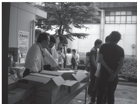
△昨年の夏季抽選会の様子

フェア期間中は、日替わり特価品や台数限定特価品などを販売する予定です。他にも電子辞書1000円offセールなども実施します。