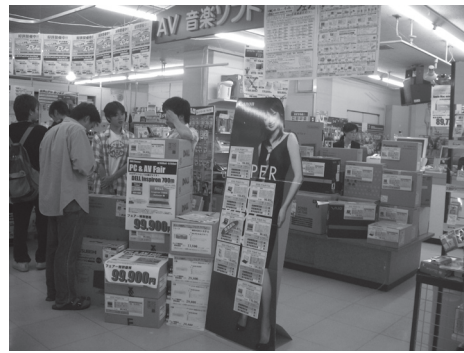
△昨年のサマーフェアの様子