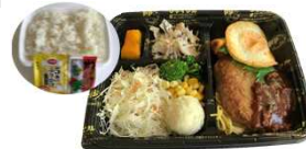
ハンバーグ弁当(※ソースは日替り)