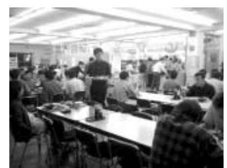
↑中は結構にぎやかです