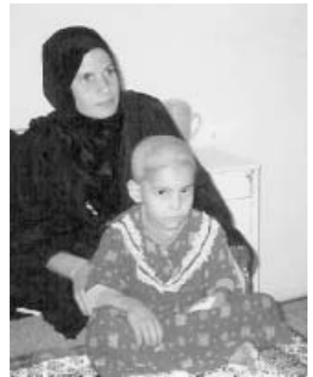
「お医者さんになりたい」という白血病の少女(右) (バスラにて)

みんな死んでいっていると思いますよ。残念ながら。日本だと無菌室に近い状態を作り、しかもどれだけ体