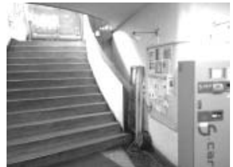
↑うわさの、風の音が聞こえる入口の階段。

理系カフェテリアには、オリジナルメニュー豊富です!(詳しくは店長のインタビューで)どうやら、隣の理系中華食堂を意識しているみたいです。いつも皆さんが利用する食堂とは一味違った雰囲気がたのしめます。また、常連さん向けなのか、食堂フェアをひっそりとやっています。理系カフェテリアは食堂の中では一番遅く、夜20:00までやっています。時間があるとき、帰るのが遅くなったときはこちらの食堂も利用してみてもいいかでしょうか?